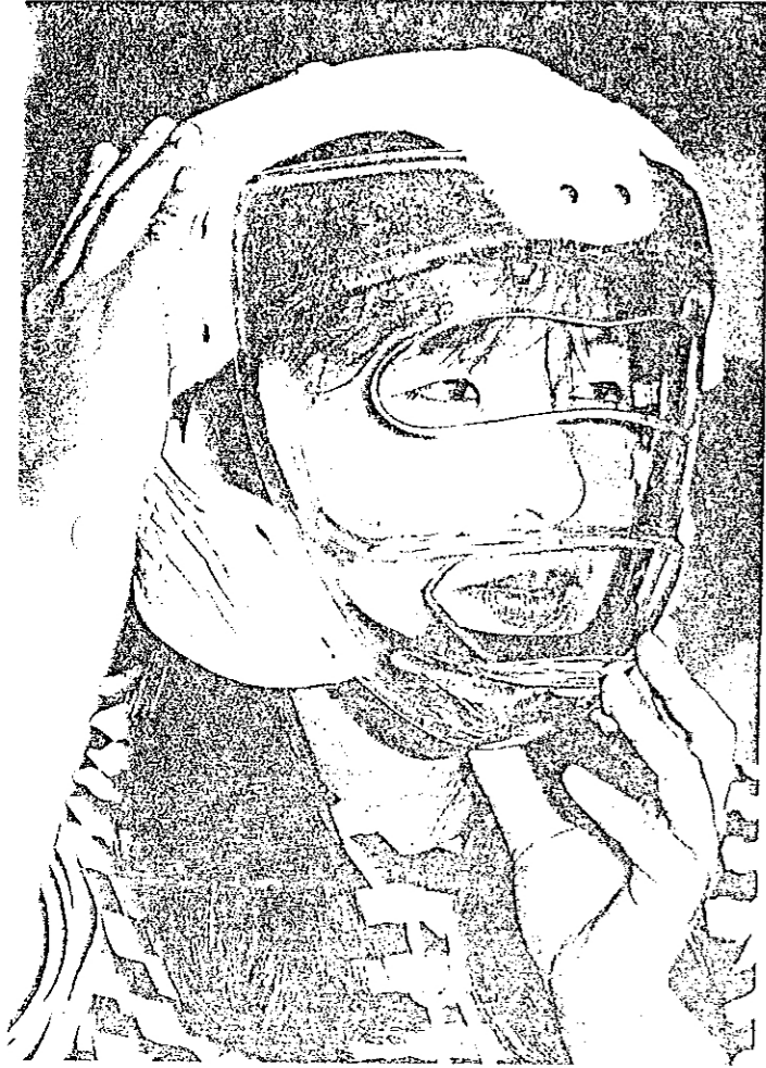
合成樹脂製の防具で顔と頭を保護する