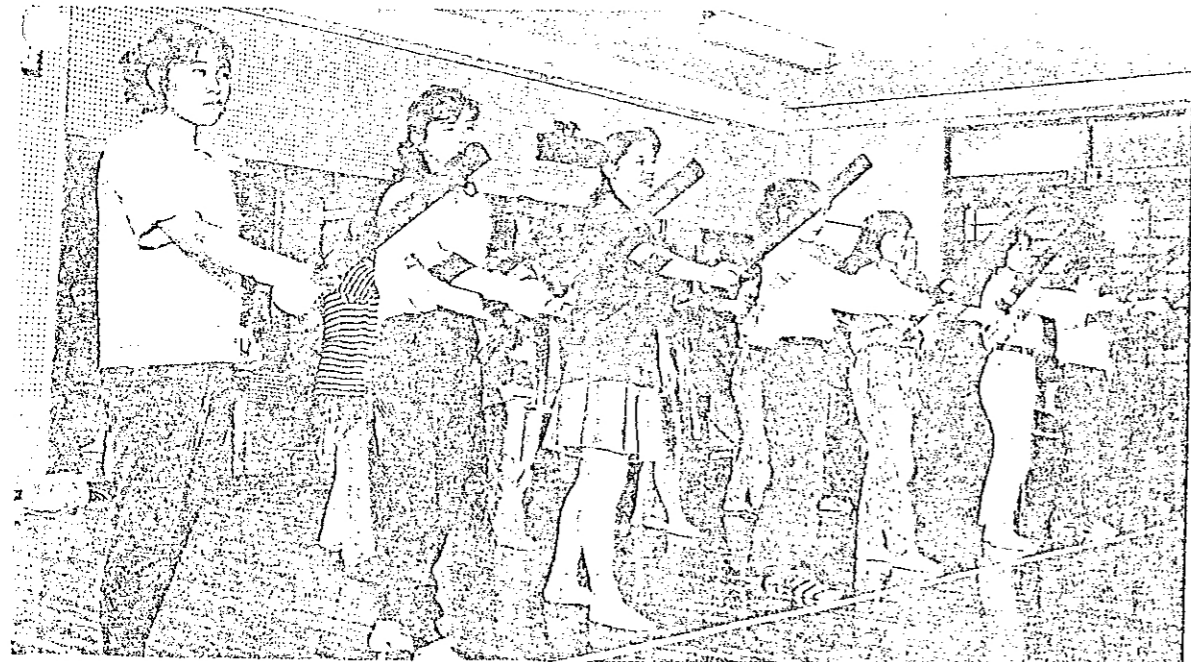
写真はいずれも愛知県岡崎市の中野岡崎女子短期大学で